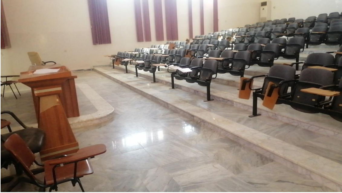
المدرج رقم (2)