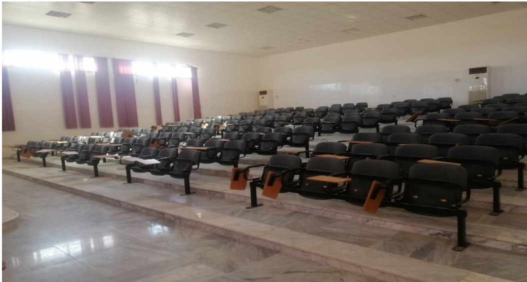
المدرج رقم (1)

ثامنا: مدرج رقم (1) ويحتوي على 140 مقعد.