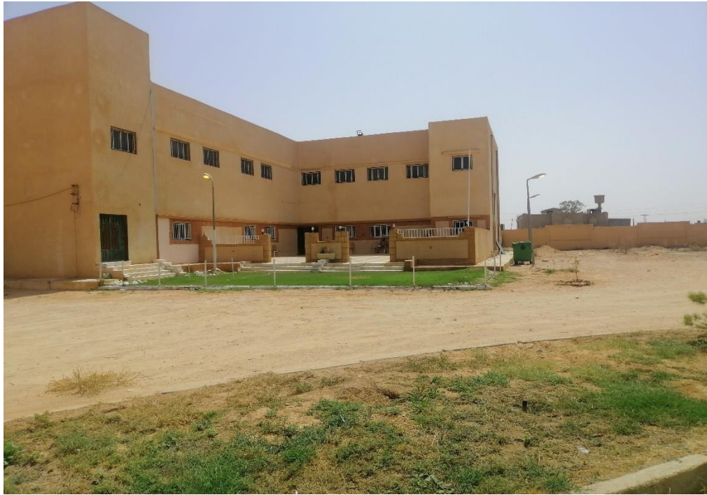
المبنى التعليمي رقم (2)