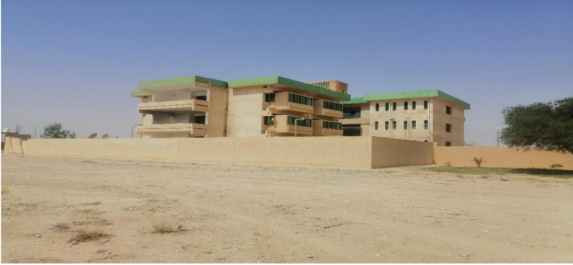
القسم الداخلي بنات رقم (2)

و يحتوي على نفس المكونات الموجودة في مبنى القسم الداخلي رقم (1)