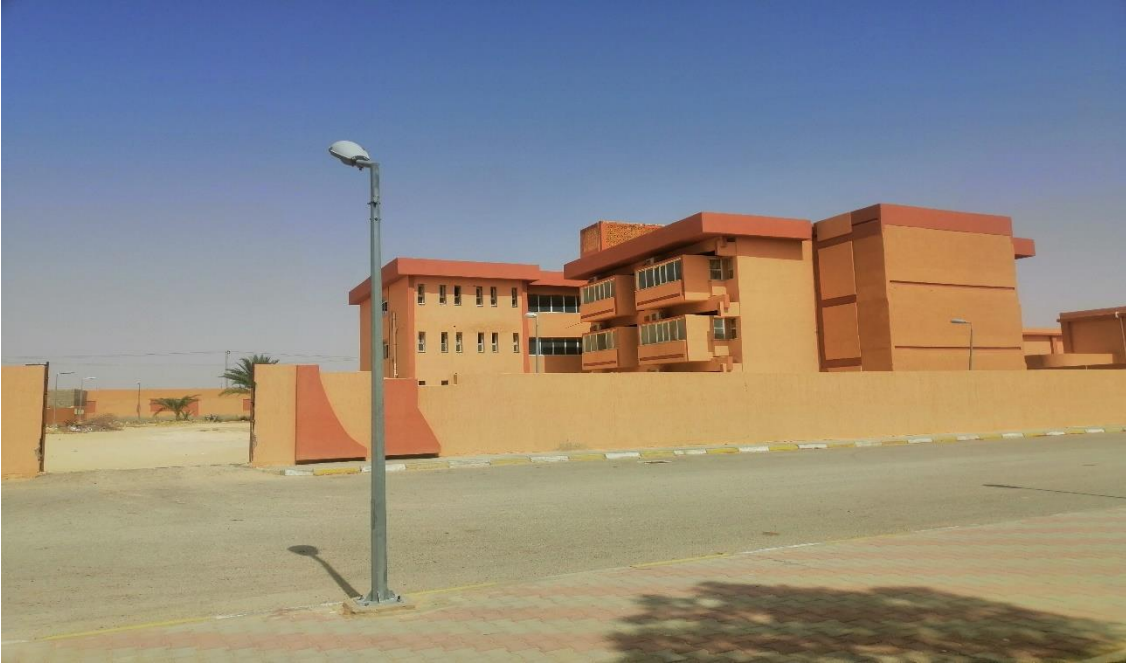
القسم الداخلي بنات رقم(1)