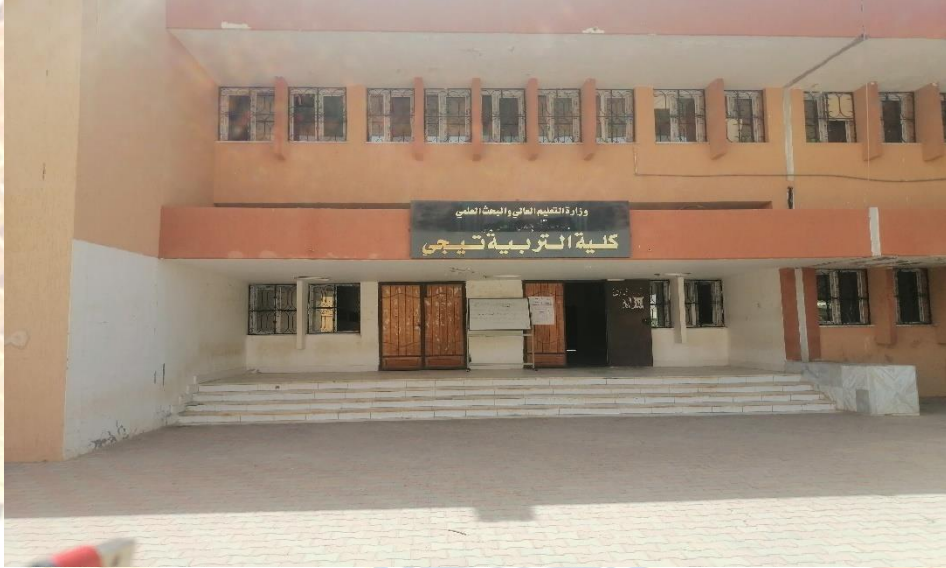
المبنى التعليمي رقم (1)