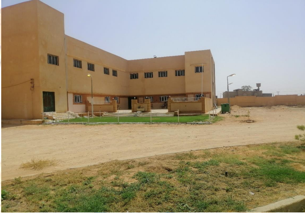
المبنى التعليمي رقم (2)